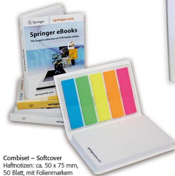
Combiset – Softcover Haftnotizen: ca. 50 x 75 mm, 50 Blatt, mit Folienmarkern Umschlag: ca. 80 x 54 mm