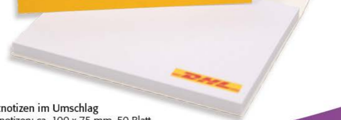
Haftnotizen im Umschlag Haftnotizen: ca. 100 x 75 mm, 50 Blatt Umschlag: ca. 102 x 76 mm