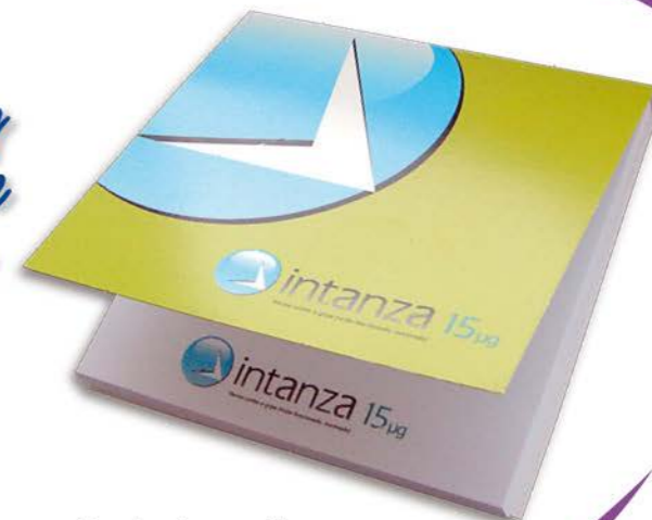
Haftnotizen im Umschlag Haftnotizen: ca. 75 x 75 mm, 50 Blatt Umschlag: ca. 76 x 76 mm