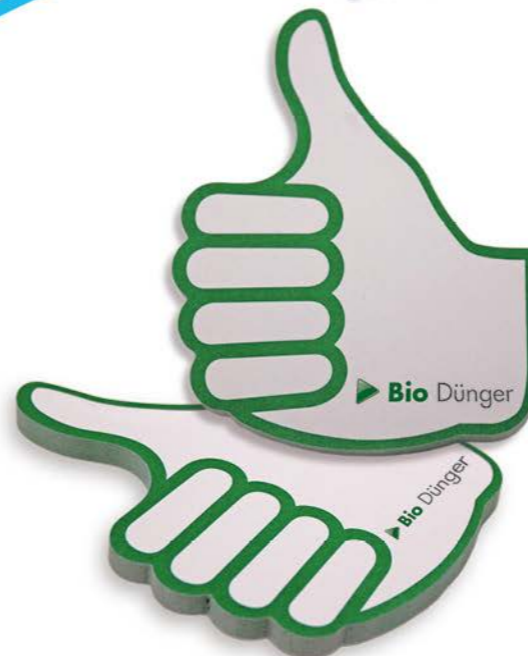
Haftnotizen – formgestanzt: Daumen hoch

viele verschiedene, vorhandene Stanzformen