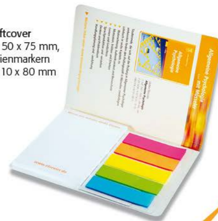
Combiset – Softcover Haftnotizen: ca. 50 x 75 mm, 25 Blatt, mit Folienmarkern Umschlag: ca. 110 x 80 mm